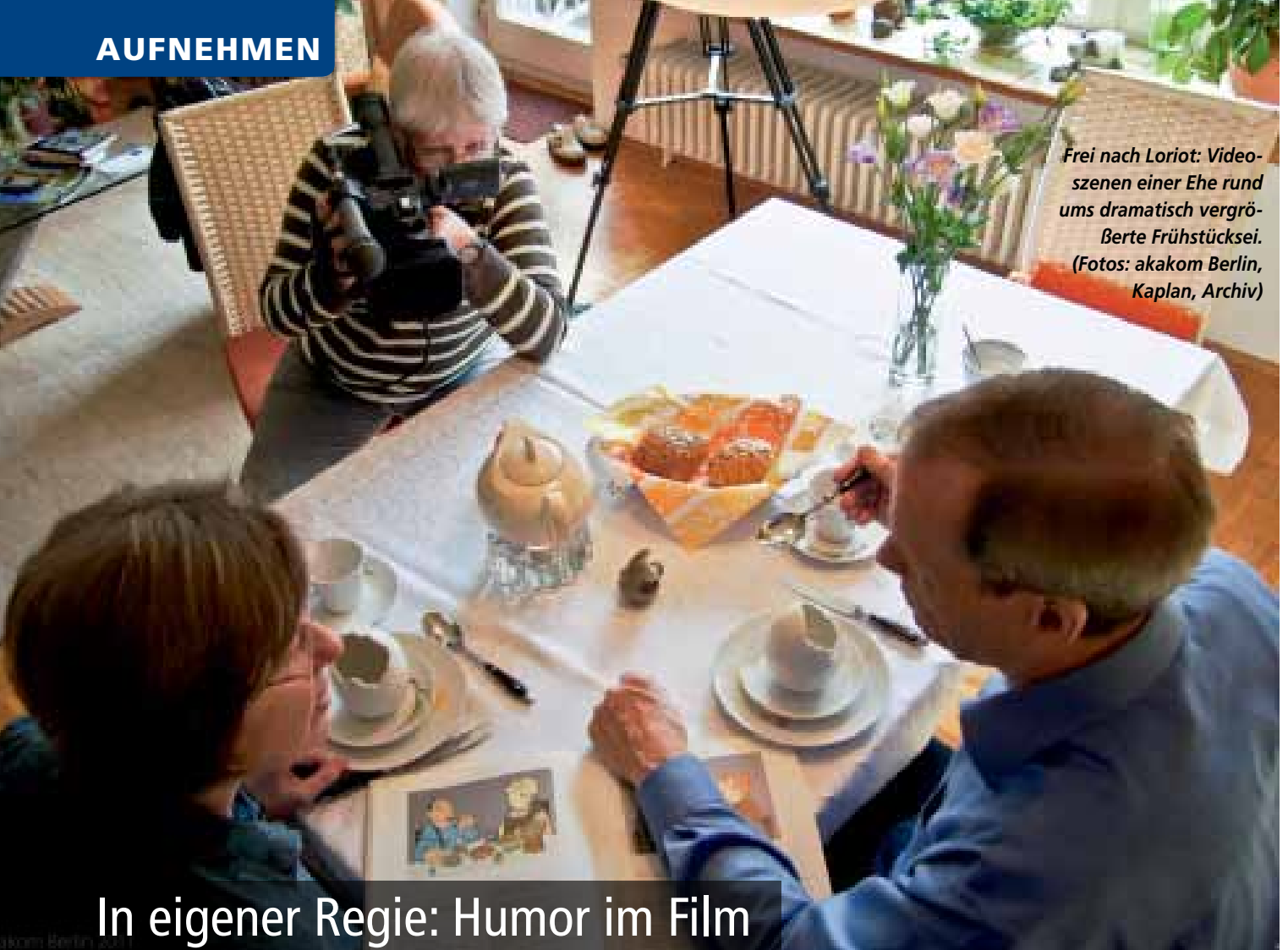
Frei nach Lorient: Videoszenen einer Ehe rund ums dramatisch vergrößerte Frühstücksei.