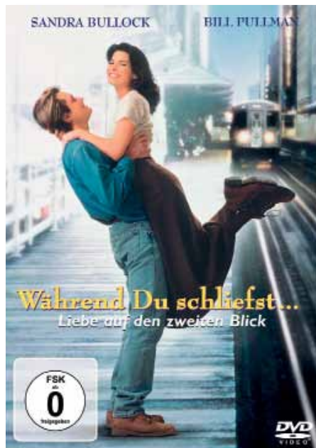
„Während Du schläfst“, auf DVD (USA 1995, Originaltitel: „While You Were Sleeping“)

Kaplan: „The comic perspective“ – also Sichtweise und Gespür für absurde und komische Situationen entwickeln und gut beobachten.