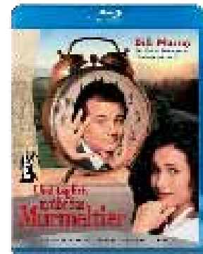
„Und täglich grüßt das Murmeltier“, auf DVD und Blu-ray Disc (USA 1993; Org. „Groundhog Day“)

Dudel: Können Komödien die Welt verbessern helfen?